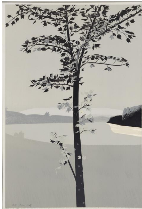
(Right) Alex Katz, Swamp Maple 2 , 1970. Lithograph of Paper, 40 1/2 x 27 3/8 inches (102.9 x 69.5 cm). Collection of the Nasher Museum of Art at Duke University, Durham, NC, USA. Gift of the Estate of Robert L. Dorfman, 2017.7.2. © Alex Katz.