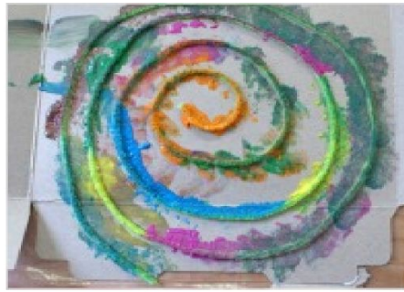
PINTA LA CUERDA